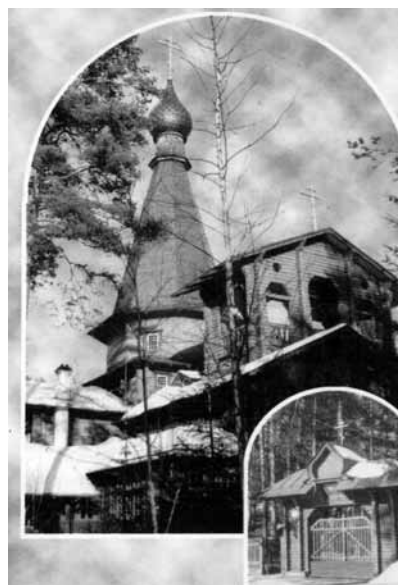
Церковь в честь Казанской иконы Божьей Матери

В миру батюшка Серафим назывался Василием Муравьевым и был известным в России купцом, торговавшим пушниной. Эту свою деятельность он совмещал с делами благотворительности и высокой духовной жизнью. После революции он решил посвятить свою жизнь Богу. Он жертвует свое имущество в пользу Александро-Невской лавры, где и при-