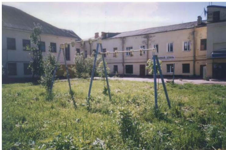
Детская площадка во дворе на ул. Красная

В 10 дворах есть песочницы (правда, во многие песочницы давным-давно не завозили песок). Кое-где виднеются остатки от спортивных площадок в виде щитка для баскетбола или стойки от футбольных ворот. Так где же проводить досуг нашим детям?