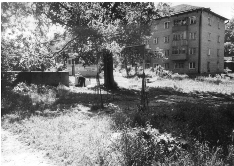
Двор на ул. Соборной

Нами была составлена карта состояния детских площадок г. Гатчины, а также сделаны фотографии, иллюстрирующие состояние детских площадок, они представлены ниже.