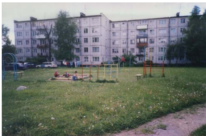
Дворы по ул. Крупской

Люди перестали устраивать клумбы, как раньше. Обидно, что в городе нет структуры, которая штрафовала бы нерадивых водителей за порчу дворов и парковку машин в неполюженном месте.