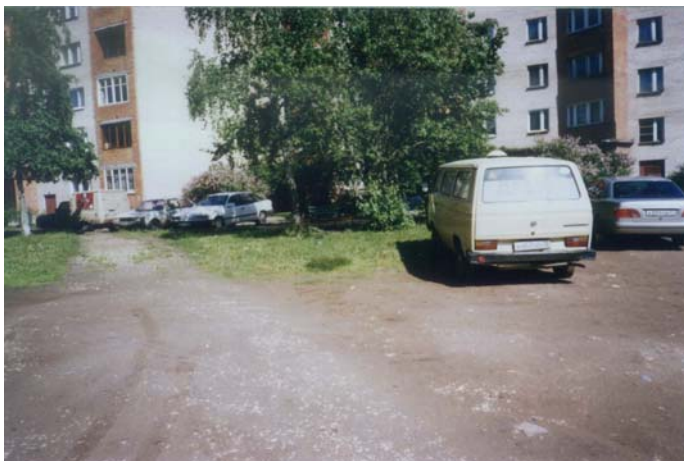
Двор на проспекте 25 Октября

В течение дня на территории между улицами Подрядчикова, Хохлова, Филлипова, Крупской было обнаружено 100 автомобилей, припаркованных в «карманах» – специальных местах для парковки автотранспорта, и 25 автомобилей, припаркованных на газонах.