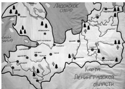
Панно «Карта Ленинградской области»