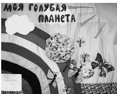
Панно «Моя голубая планета»

Начальной формой любой деятельности является ее коллективное выполнение, и лишь постепенно она становится индивидуальной. Мы широко применяем групповую форму организации работы учащихся. Групповая работа привлекает участников общением, деловой направленностью, возможностью лучше узнать одноклассников, сравнить себя с ними и расширить зону для самооценки. Так, коллективные работы, выполненные учащимися нашей школы, это панно «Наш мир» (размер 3000х1600 см), состоящее из 120 фрагментов – индивидуальных работ в технике аппликации; панно «Моя голубая планета» (размер 160х125 см), выполненное в технике лоскутного шитья и аппликации; панно «Ленинградская область» (размер 200х150 см); панно «Цветочная поляна» (размер 120х90 см) и т. д. Такая групповая работа позволяет проявлять взаимопомощь и вместе с тем стимулирует дух соревнования и соперничества, активизирует желание проявить себя в индивидуальном проекте.